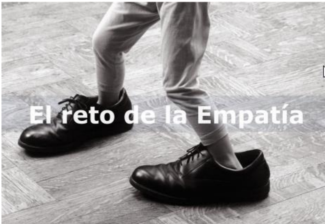
Imagen 1 Empatía ponerse en los zapatos del otro. https://seminarioiiuntref.wordpress.com/2016/05/24/empatia-ponerse-en-los-zapatos-del-otro/