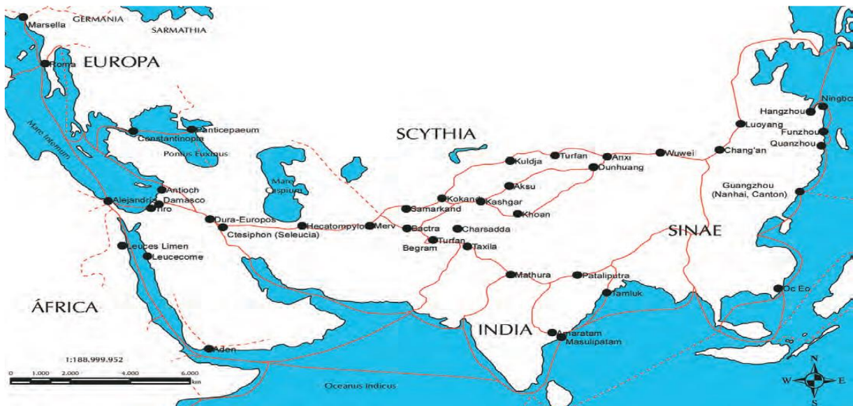
RUTA DE LA SEDA

La Ruta de la Seda es el recorrido de una amplia red de caminos que en la Antigüedad unió a los imperios de China y Roma. Por estos caminos las sedas del Oriente llegaron a Europa a vestir a las importantes y elegantes damas del Imperio Romano. Tradicionalmente, uno de los extremos de la Ruta se situaba en la ciudad de Roma y el otro en la ciudad de Xian o la antigua Changan en China, sus diversos caminos cruzaban ciudades como Damasco, Bagdad, Samarkanda y espacios geográficos de gran importancia como el Macizo de Pamir, con alturas que superan los 5.000 metros de altura, los desiertos de Gobi en territorios de Mongolia y Taklamakán cuyo nombre quiere decir "lugar donde entras pero no sales".