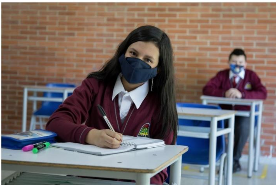
Imagen 1 Cómo se hará la reapertura gradual, progresiva y segura de los colegios en Bogotá? https://bogota.gov.co/mi-ciudad/educacion/colegios-vuelven-educacion-presencial-con-alternancia-y-bioseguridad