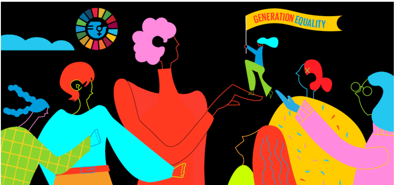
Imagen 1. Generación Igualdad (ONU-Mujeres)