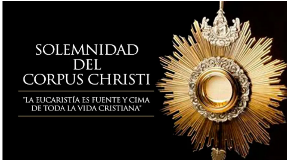
Imagen 3 Solemnidad del Corpus Christi

El pasado jueves 3 de junio de 2021 la Iglesia Católica celebró La fiesta del Corpus Christi . Revisa la imagen (4) de la Hojita Dominical y léela detenidamente. Luego, responde: