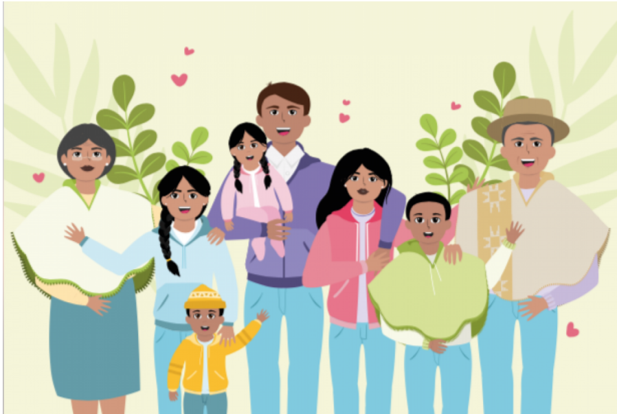
Imagen 2 Familias protectoras

En la guía La infancia y el país que soñamos (guía 8) buscábamos explorar cuales son tus sueños, deseos, metas, habilidades y fortalezas. Todo para descubrir tus capacidades y saber cómo entrenarte en búsqueda de proyectos de vida que puedan ser espacios de paz en Colombia.