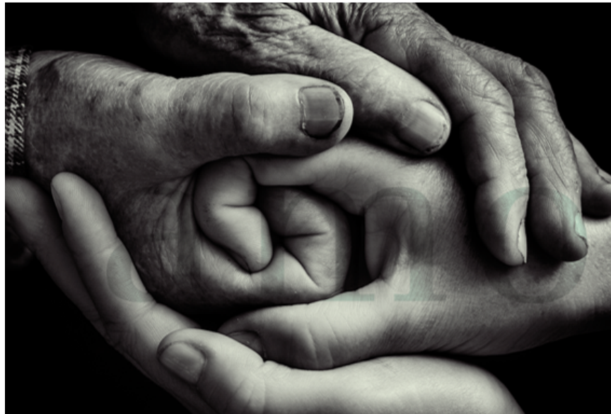
Imagen 1 Diferentes manos unidas de una familia

La vida en familia supone atravesar momentos alegres y tristes, pero es en la familia donde recibimos amor, comprensión, tolerancia, solidaridad y fraternidad. Todos tenemos derecho a una familia, a crecer en ella, a aportar, enriqueciéndola con nuestra presencia y con acciones positivas. Con sus bondades y defectos, la familia nos proporciona abrigo, protección, alimentación y en el hogar nos relacionamos, somos felices, aprendemos y compartimos con nuestros seres queridos. Hay familias de todas las clases, unas son pequeñas: donde hay una madre y un hijo. Las hay gigantes, con muchos hijos, hermanos, tíos, abuelos.