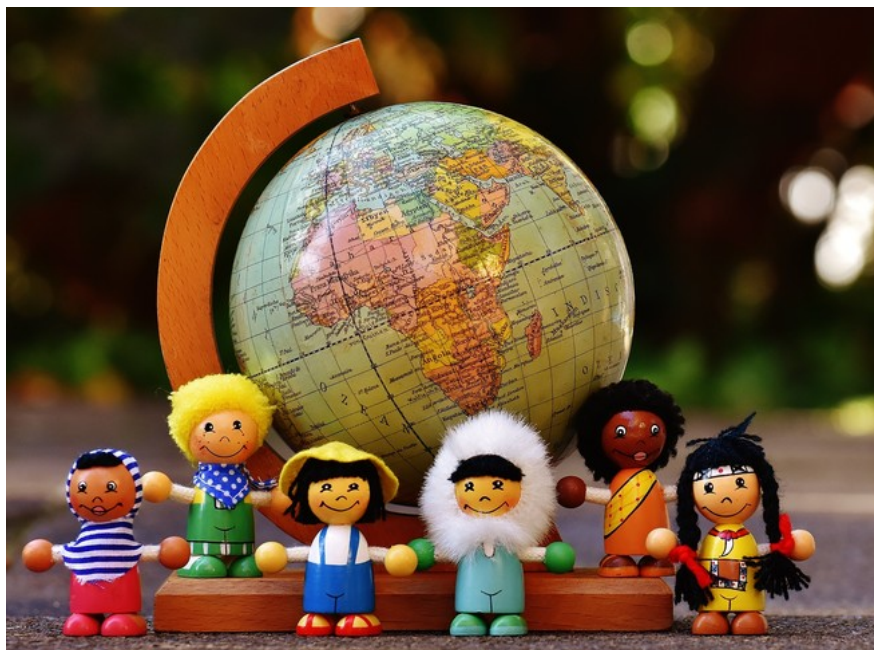
Imagen 1. Imagen para ilustrar la celebración de El día de las niñas y niños , la infancia

¿SABES POR QUÉ ES IMPORTANTE LA CELEBRACIÓN DE EL DÍA DE LAS NIÑAS Y NIÑOS ?... PARA LA ORGANIZACIÓN DE NACIONES UNIDAS (ONU), EL DÍA DEL NIÑO OCURRE CADA 20 DE NOVIEMBRE TOMANDO COMO FECHA PRINCIPAL LA DECLARACIÓN DE LOS DERECHOS DEL NIÑO DEL AÑO 1959 . EN COLOMBIA CONMEMORAMOS ÉSTE DÍA CADA AÑO, EL ÚLTIMO SÁBADO DE ABRIL (24-04-2021). SI QUIERES SABER MÁS VISITA HTTPS://NACIONESUNIDAS.ORG.CO/NOTICIAS/DIA-MUNDIAL-DE-LOS-NINOS-Y-LA-CONVENCION-SOBRE-LOS-DERECHOS-DEL-NINO-PARA-CADA-NINO-TODOS-LOS-DERECHOS/