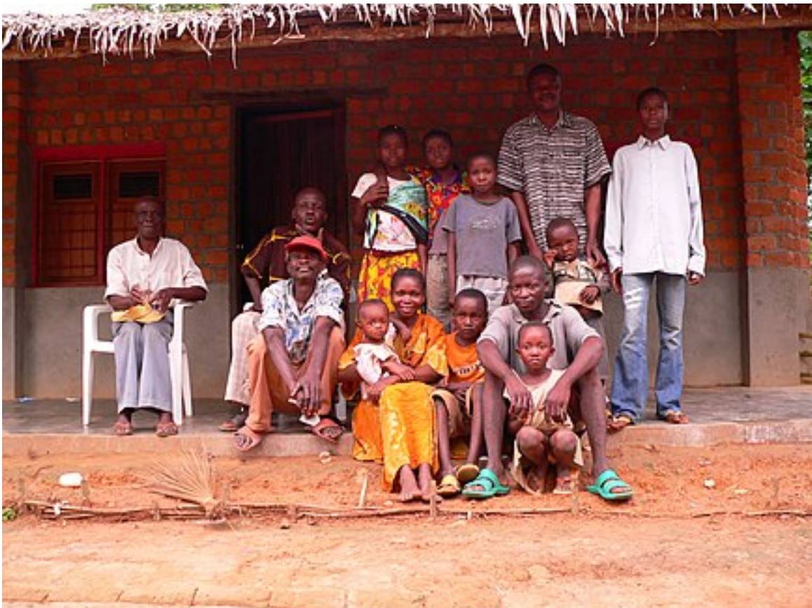
Imagen 1. Encuentro familiar . Familia típica del Congo