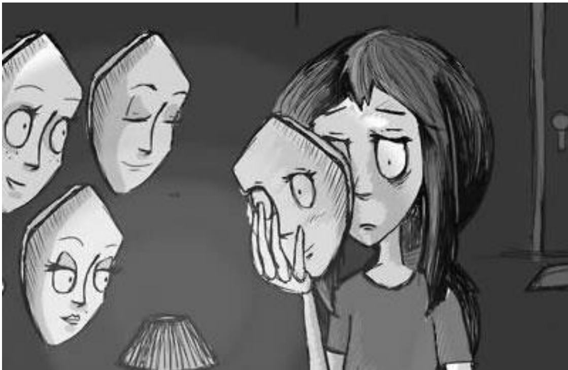
Imagen 1 https://www.psicomaster.es/como-afrentar-los-cambios-emocionales-en-la-adolescencia/