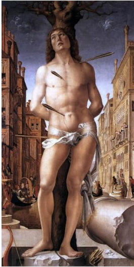
LIBERALE DA VERONA, San Sebastián