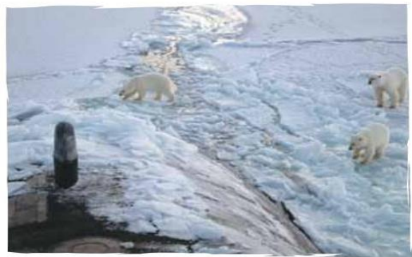
Un panorama similar al que se presenta actualmente en las regiones polares, debió suceder durante los periodos de las glaciaciones.

de rotación, lo cual influye en la forma como el planeta recibe la radiación solar.