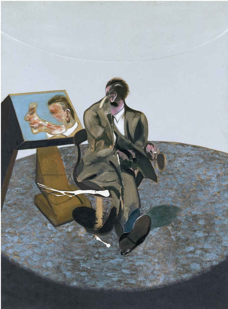
FRANCIS BACON, Retrato en un espejo

La crítica que hace Nietzsche previene contra una forma desviada de entender la humillación de Jesús y la humildad del creyente: una religión que no potencia a las energías vitales de la persona, sino que crea seres apocados y frustrados. Denuncia aquellos que entienden el amor cristiano como debilidad y refugio de débiles, sin captar toda la fuerza que hay en la entrega libre y soberana de Jesús.