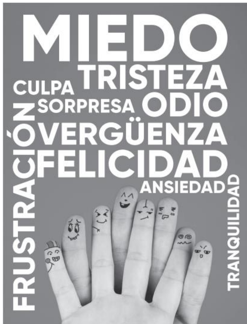
Imagen 1 Portal Colombia Aprende – Navegar Seguro Manejo de Emociones