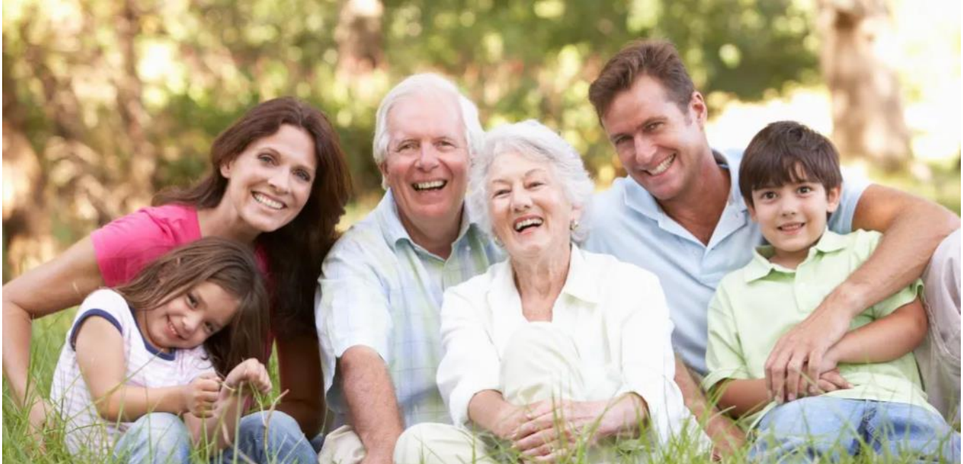
Imagen 2 https://www.yosoydeleotec.com/nueva-leotec-fashion-health/

Los abuelos son una de las figuras más importantes de la familia. Cada familia está llamada a reconocerles toda su historia, sus enseñanzas, sus consejos, sus narraciones y brindarles además, comprensión, respeto y apoyarles para que se sientan miembros funcionales, jubilosos e importantes en cada una de las familias. Brindarles tiempo y acompañamiento permitirá que nuestros abuelos se sientan felices por lo que han hecho en su vida.